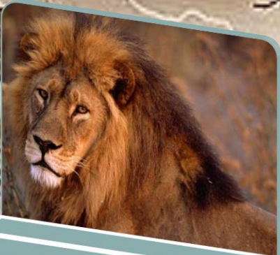
Lev: Divoká zvířata

Jsou úzce spojeni se zemí, a to jak svým počtem, tak svým vzhledem.