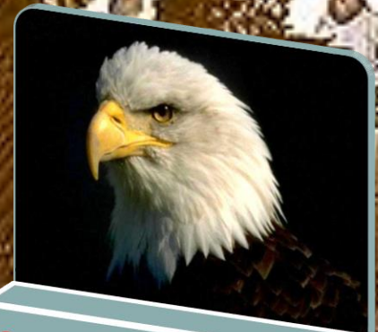
Orel: létavá zvířata.