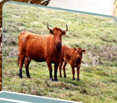
Býk: Domácí zvířata