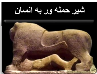
شیر حمله ور به انسان