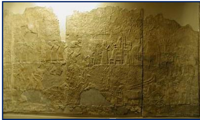
نقش حکاکی شده که نشان دهنده نابودی لاکیش