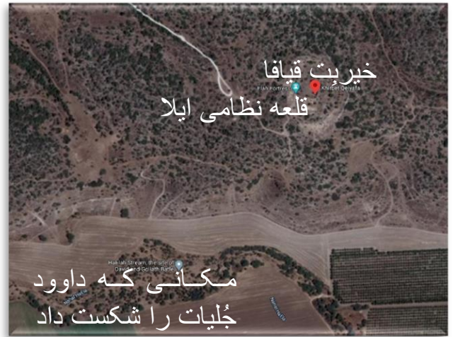
خبریت قیافا قلعه نظامی ایلا