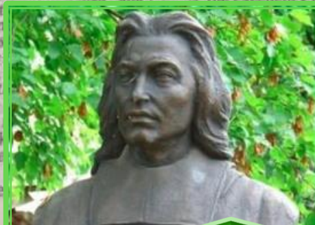
Jurij Dalmatin Slovène (1584)