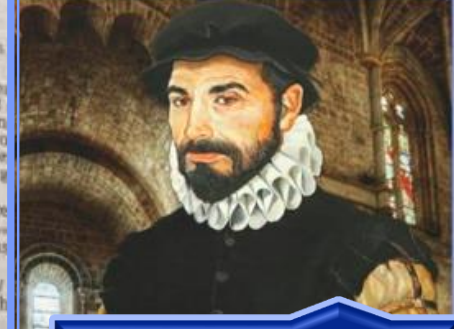
Casiodoro de Reina Espagnol (1569)