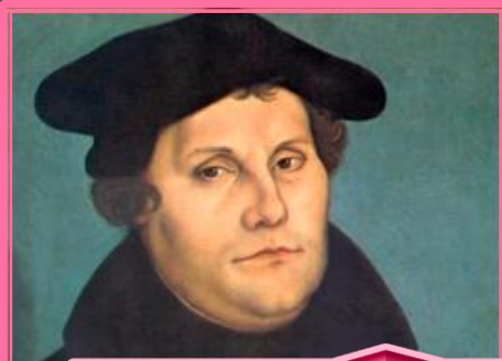
Martin Luther Allemand (1534)

Pendant que les versions anglaises de la Bible étaient préparées et publiées, d'autres réformateurs ont également traduit la Bible dans leur langue maternelle. De cette manière, la Bible pouvait être lue directement par les habitants de l'Europe et du "Nouveau Monde" nouvellement découvert.