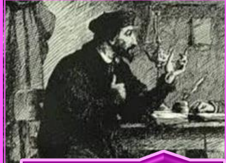
Pierre Robert Olivétan Français (1535)