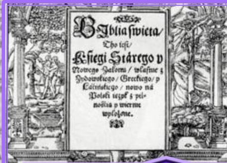
Bible de Brest Polonais (1563)