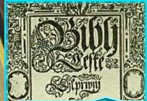
Bible de Kralice Tchèque (1579)