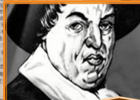
João Ferreira de Almeida Portugais (1691)