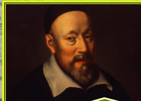
Giovanni Diodati Italien (1607)