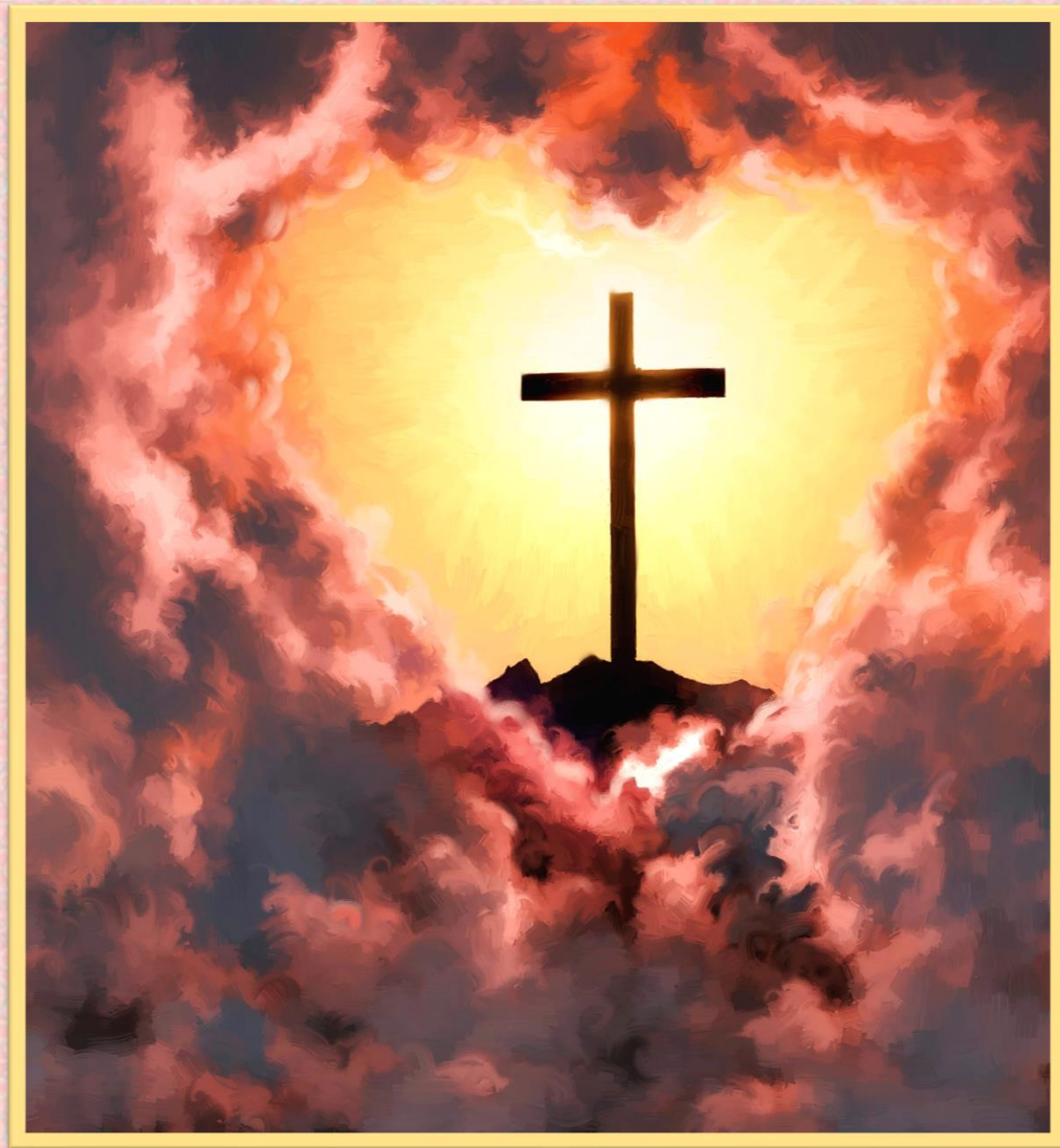
Ellen G. White, Veliki sukob , str. 678 original.

“Veliki je sukob završen. Grijeha i grešnika više nema. Cijeli svemir je čist. Bilo neizmjerana svemira kuca istim otkucajem sklada i radosti. Od Njega koji je sve stvorio, teče život, svjetlost i radost, kroz prostranstva beskrajnog svemira. Od najmanjeg atoma do najvećeg svijeta, sve živo i neživo, u svojoj nepomućenoj ljepoti i savršenoj radosti, objavljuje da je Bog ljubav.»